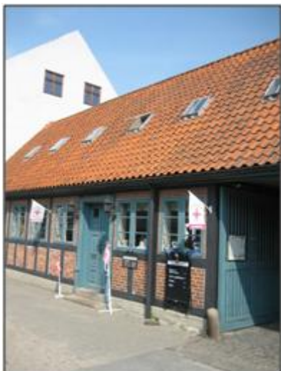
Løgstrupgården Vestertorv 16 8900 Randers C Tlf. 86 42 03 80 randersby.kk@gmail.com